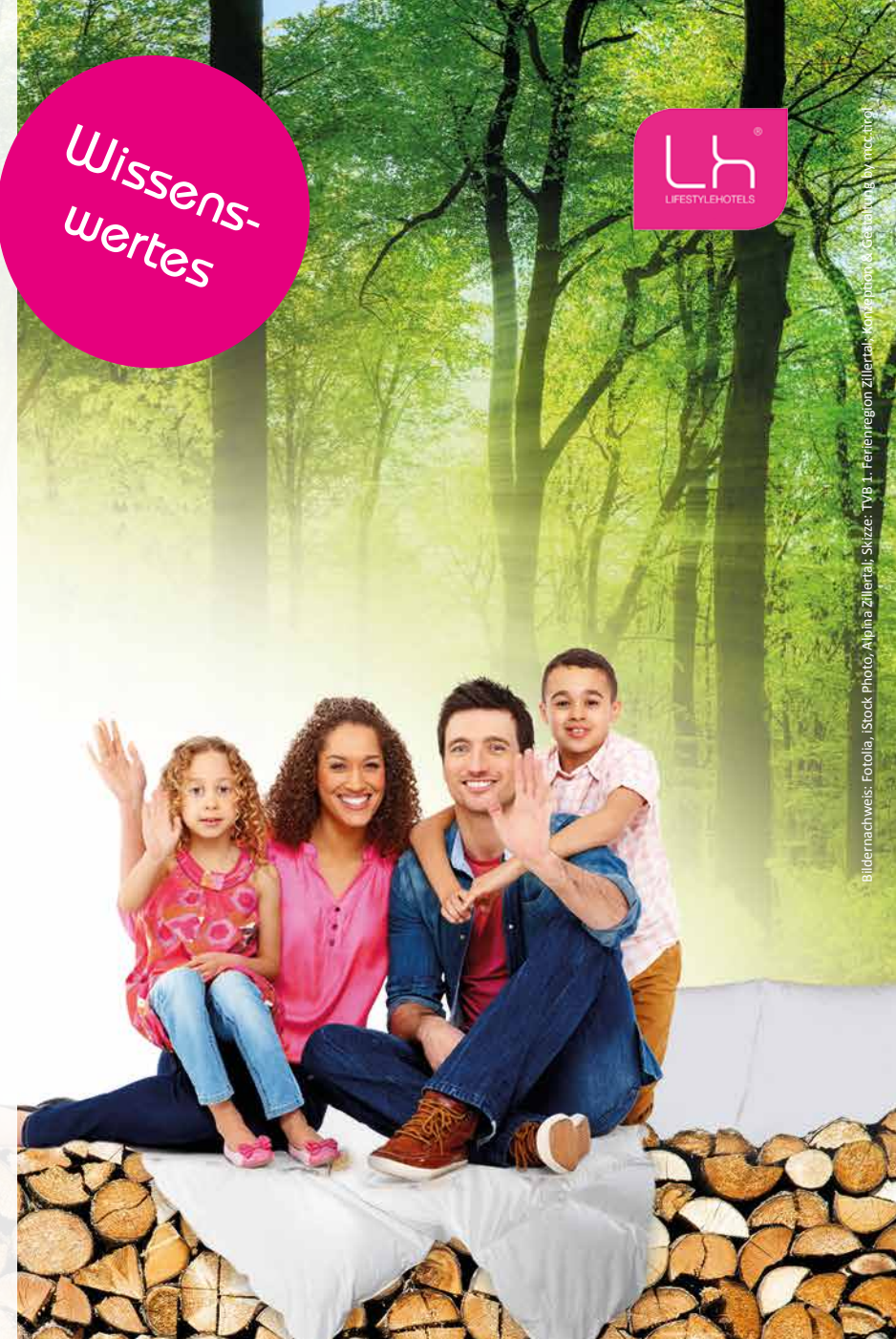
Bildernachweis: Fotolia, iStock Photo, Alpina Zillertal, Skizze: TVB 1. Ferienregion Zillertal, Kompagnon, © Gestaltung: m.mccarty